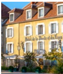
Hôtel de la Poste et du Lion d'Or**** Vézelay